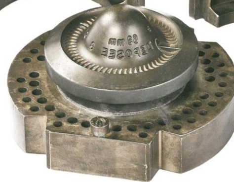
MOULE À COULER LES BOUTEILLES