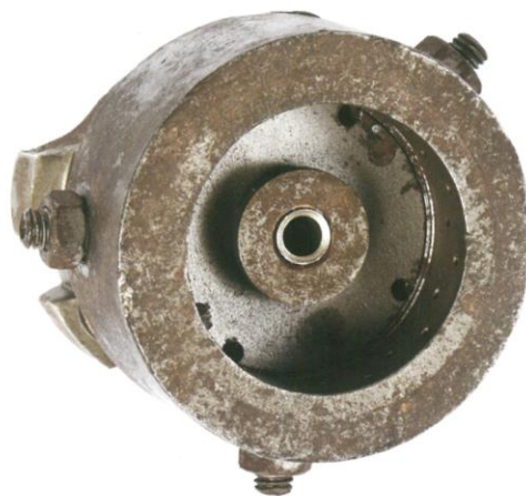
MOULE À COULER LES BOUTEILLES "LA RHODANIENNE"

« Ancienne bouteille des Côtes-du-Rhône »