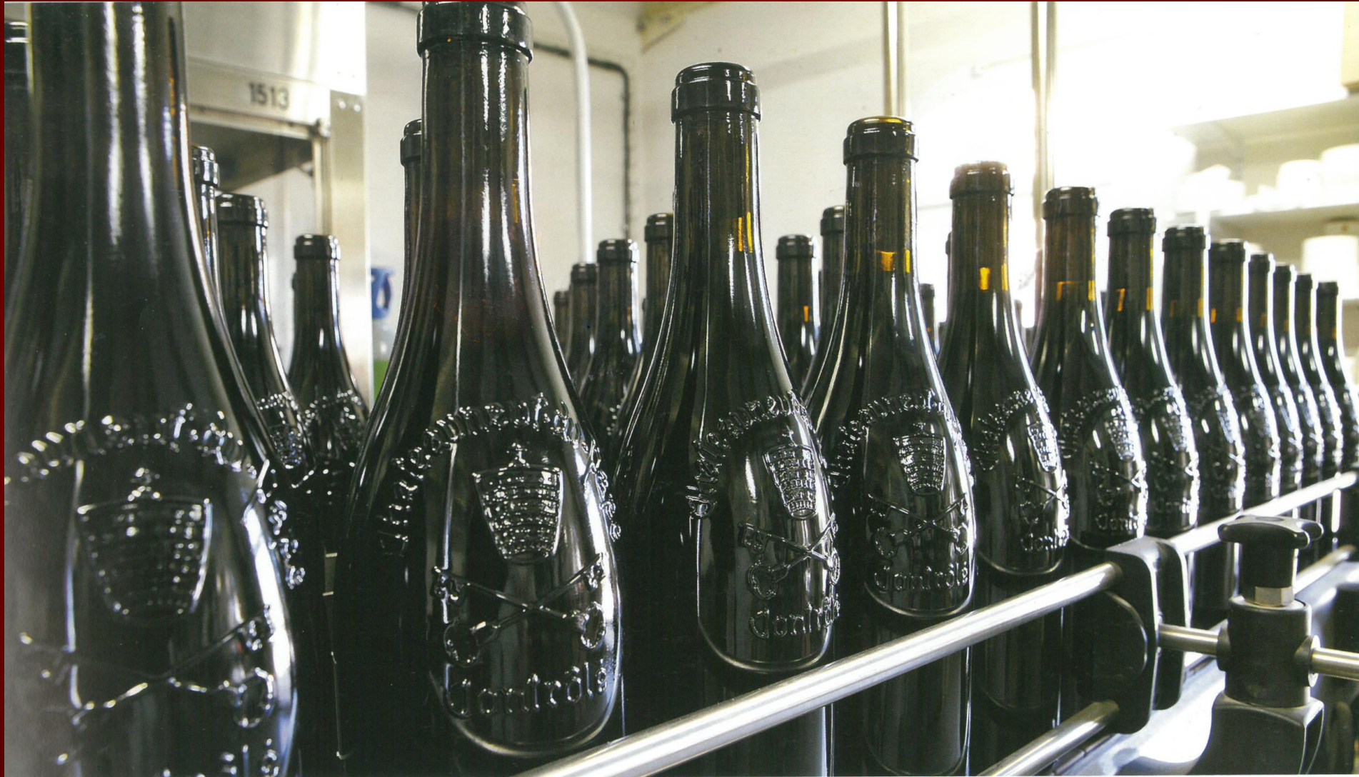
LA BOUTEILLE ARMORIÉE